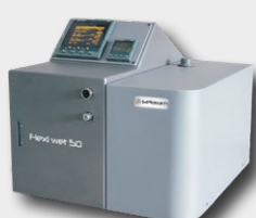
FLEXI WET Contrôle d'humidité