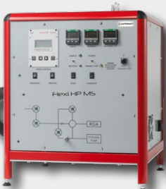
FLEXI HP MS Analyse de Gaz émis